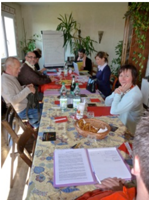
Tout le monde au travail après la pause photo !