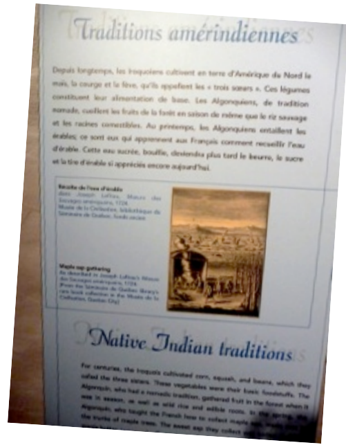
Le Château RAMEZAY et le Musée Marguerite-Bourgeoys, qui permettent de comprendre l'histoire de la Nation Québécoise et de la création de Montréal.